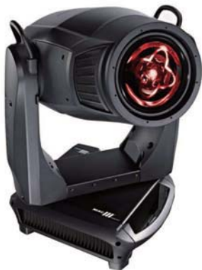
MAC III Profile