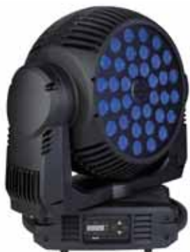
MAC 401 Dual