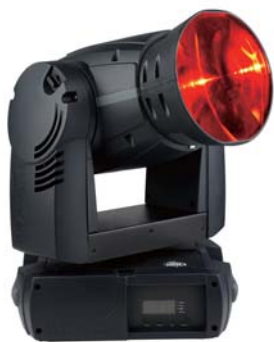
MAC 250 Beam